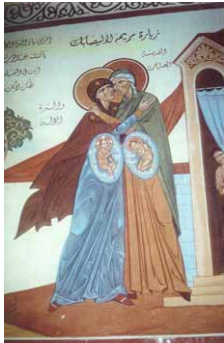
Maria und Elisabeth Kloster Dair An-Natour, „Unsere Herrin der Wachsamkeit“ Libanon, Wandmalerei 20. Jh.