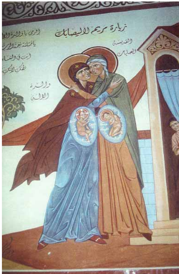
Maria und Elisabeth Kloster Dair An-Natour, „Unsere Herrin der Wachsamkeit“ Libanon, Wandmalerei 20. Jh.