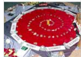
Gottesdienst der Ev. Frauenhilfe 06.12.2009, 9:45 Uhr, Ev. Kirche Roßdorf

Einladungsplakat Kirchengemeinde Roßdorf