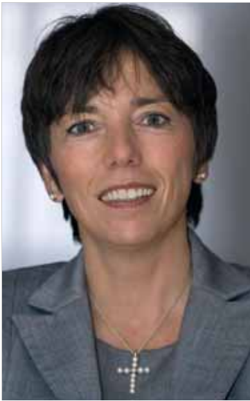
Dr. Margot Käßmann