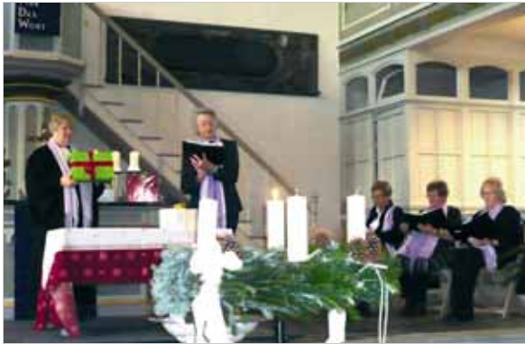
Frauen des Kirchspiels Holzappel gestalteten den Gottesdienst zum 2. Advent 2009 in der Johanneskirche.