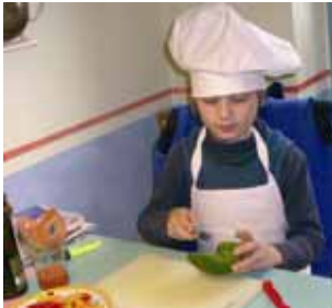
Kinder kochen mit Spaß