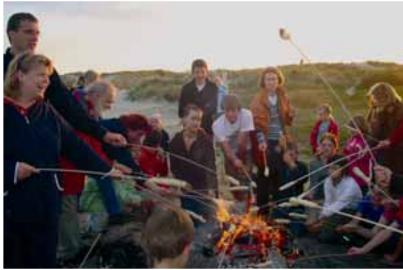
Strandleben am Abend mit Stockbrot grillen

zu lassen und neue Impulse für ein gelingendes Zusammenleben in der eigenen Familie zu bekommen.