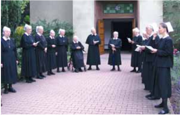
Einstimmen auf das 138. Jahresfest des Frankfurter Diakonissenhauses, das am 15. Juni gefeiert wurde