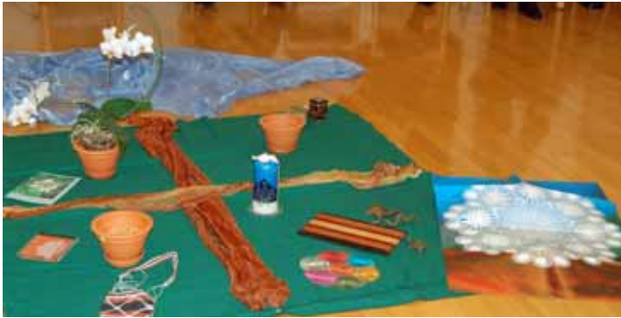
Die „Mitte“ bei der Tagung in Bad Soden

Frauen aus zehn Konfessionen bilden das Paraguayische Weltgebetstagskomitee. Sie haben die Gottesdienstordnung erarbeitet. Sie berichten von der Schönheit des Landes, dem kulturellen Reichtum und von den drängenden wirtschaftlichen und sozialen Problemen. Erst 1989 ging die fast 35-jährige Diktatur unter Alfredo Strössner zu Ende. Aber immer noch regiert „seine“ Coloradopartei. Wegen der überall vorherrschenden Korruption gestaltet sich der Demokratisierungsprozess äußerst schwierig. Nun scheint es für die Paraguayerinnen an der Zeit, nach Verbindendem zwischen den verschiedenen Gesell-