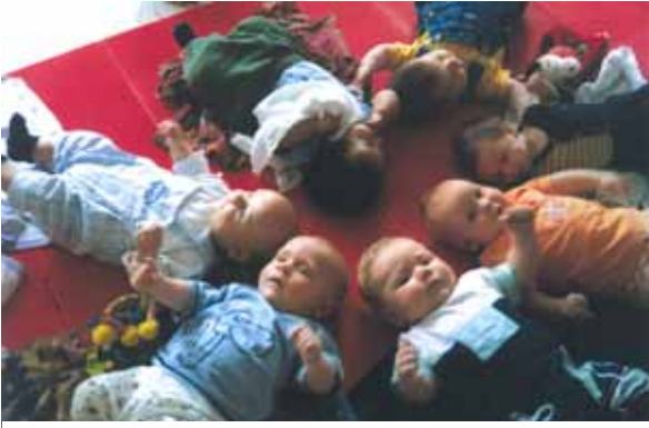
Die jüngsten Teilnehmerinnen und Teilnehmer in der Evangelischen Familien-Bildungsstätte Gießen