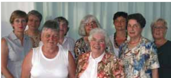
Die Mitglieder des Vorstands des Fördervereins der Ev. Familien-Bildungsstätte Gießen im Jubiläumsjahr