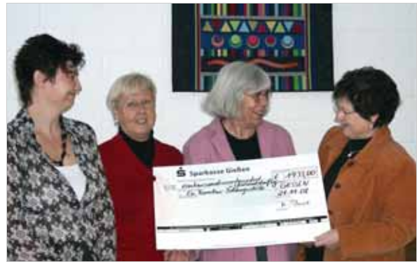
Der Lohn ihrer Arbeit: Mitglieder des Fördervereins der Ev. Familien-Bildungsstätte Gießen bei der Geldübergabe

26. Juni 2010, ab 16.00 Uhr Jubiläums-Mitgliederversammlung des Fördervereins der Evang. Familien-Bildungsstätte Gießen e.V. Herzliche Einladung zum Mitfeiern!