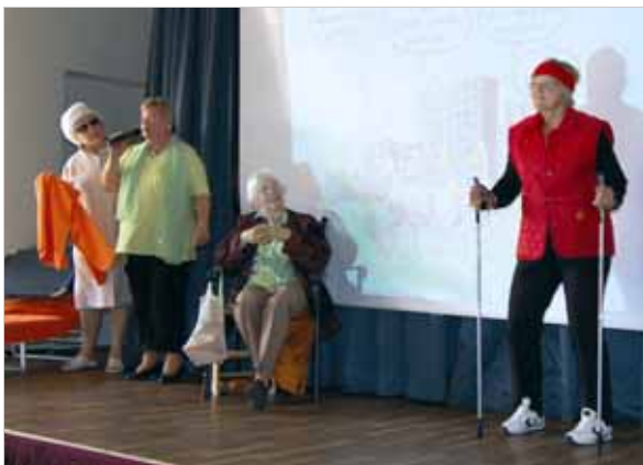
Am 7. April trafen sich unter dem Motto ‚Wir sind nicht mehr die Jüngsten – was Frauen im Alter stark macht‘ die Frauen im Dekanat Worms-Wonnegau zu ihrem jährlichen Frauentag