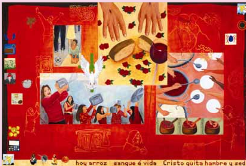
„Brot und Rosen“ ist der Titel des von Frauen aus Guatemala gestalteten Hungertuchs, die im Frankfurter Frauengefängnis Preungesheim inhaftiert waren.

Anstatt zum Dekanatsfrauentag im Dekanat Wöllstein laden die Evangelischen Frauen in diesem Jahr alle interessierten Frauen zu diesem großen gemeinsa-