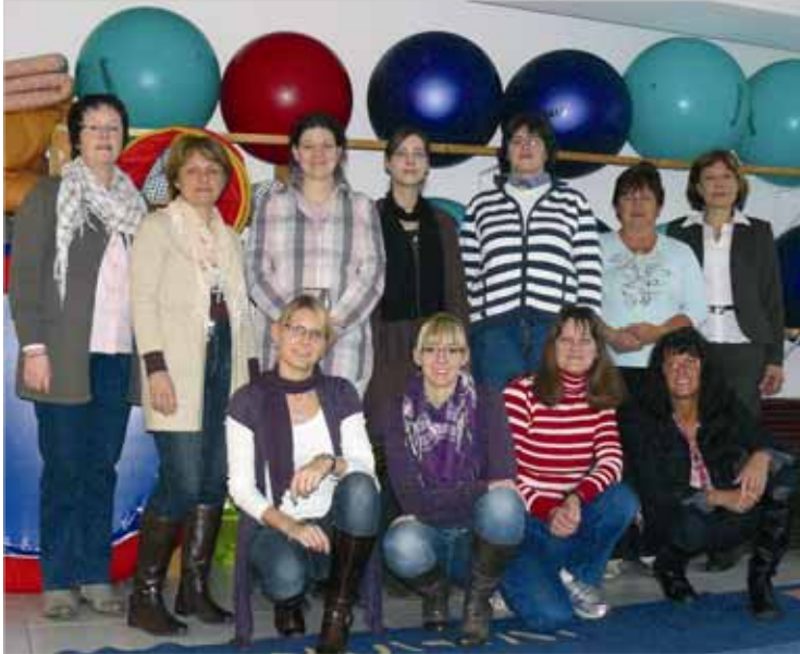
„Mit Eltern im Dialog“ sind die Wetterauer Tagesmütter!