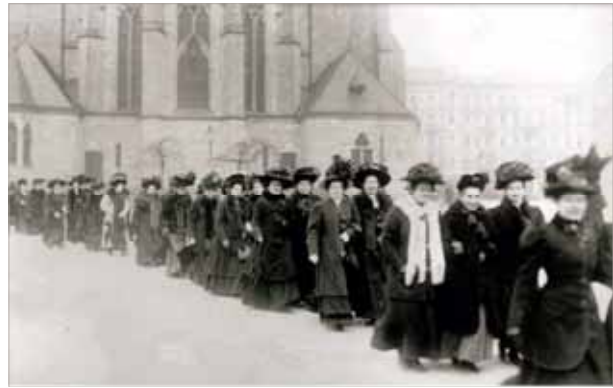
Demonstrationszug in Berlin anlässlich des ersten Internationalen Frauentages 1911

Rosel Tews , Öffentlichkeitsarbeit Quelle www.equalpayday.de