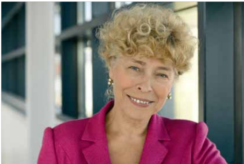
Prof. Dr. Gesine Schwan ist Präsidentin der HUMBOLDT-VIADRINA School of Governance in Berlin, Mitglied der SPD, und kandidierte zweimal für das Amt der Bundespräsidentin.

Gleichberechtigung von Frauen wird es erst dann geben, wenn sich gegen solche Rollenklischees das Prinzip Partnerschaft kulturell, ökonomisch und politisch durchgesetzt hat. Partnerschaft verlangt Freiheit eines jeden und Verhandlung auf Augenhöhe über alles, was uns persönlich und politisch betrifft – auf der Basis gegenseitiger Anerkennung. Partnerschaft ist das zeitgemäße Schlüsselprinzip für eine Gleichheit, die gerade nicht nivelliert, sondern den Unterschieden in Freiheit Rechnung trägt. Dabei kommt der Rollenverteilung in der Familie eine zentrale, weil alle Umgangsweisen in der Gesellschaft prägende Bedeutung zu. Nach wie vor haben Frauen überwiegend mit der Doppelbelastung durch Beruf und Familie zu kämpfen und verzichten deshalb in Deutschland viel-