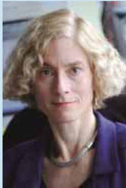
Martha C. Nussbaum