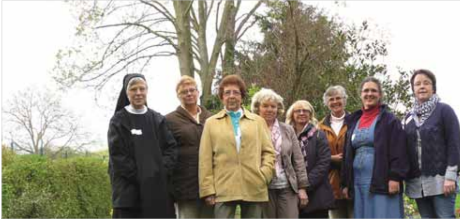
Sie haben sich einen ganzen Tag Zeit füreinander im Kloster Engelthal genommen.