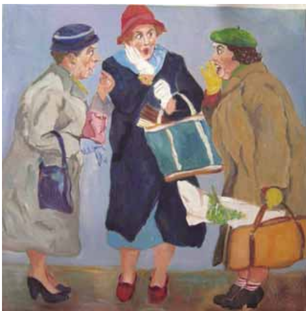
„Lebenslust“, Ölgemälde von Ilona Nolte

Heute wollen wir in der Gruppenarbeit drei Aspekte näher betrachten: