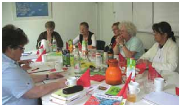
In Frankfurt und Darmstadt treffen sich Frauen monatlich zur Kollegialen Beratung feministisch-theologischer Praxis.

dem Lebensfluss vertrauensvoll in die Arme werfen, weil unsere Vormütter und –väter unsere Zukunft vorbereitet hätten. Nicht allein in unserem Erinnern, sondern in unserem Sein und Tun, das an sie anknüpfe, würden sie wieder lebendig. Der muntere Austausch verebbte auch beim anschließenden Mittagessen nicht. Mehr Informationen zu „Kollegiale Beratung feministisch-theologischer Praxis“ bei Kristin.Flach-Köhler@EvangelischeFrauen.de