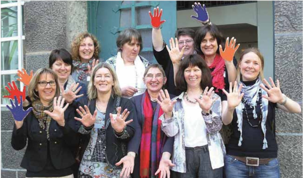
Im Auftrag des Wetteraukreises arbeitet das gemischte Team aus AWO- und FBS-Mitarbeiterinnen im Fachservice Pflegefamilie. Bunte Hände gehören zum Logo des Fachservice Pflegefamilie.