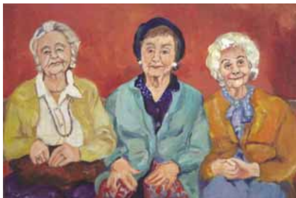
„Lebenslust“, Ölgemälde von Ilona Nolte, Foto: Elisabeth Becker-Christ