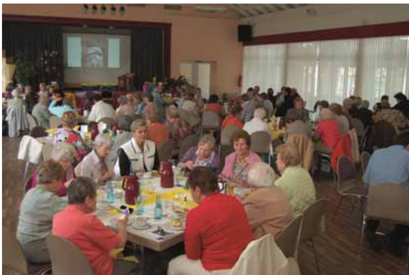
Bild: Der Frauentag im Dekanat Worms-Wonnegau lockte fast 100 Besucherinnen.