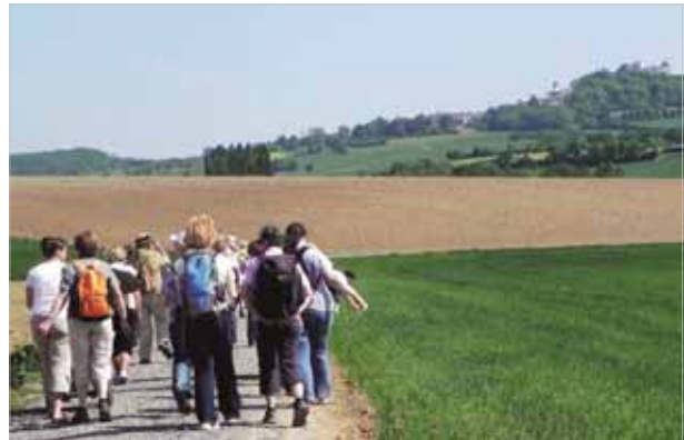
Die Pilgerinnen auf ihrem Weg im Odenwald.

Diese Veranstaltung wird von der Arbeitsgemeinschaft für Erwachsenenbildung der Evangelischen Kirche in Hessen und Nassau gefördert. Für Mitarbeiterinnen in der EKHN ist die Werkstatt als Fortbildung anerkannt, „Wissenswerte“ 2011 (Nr. 1024)