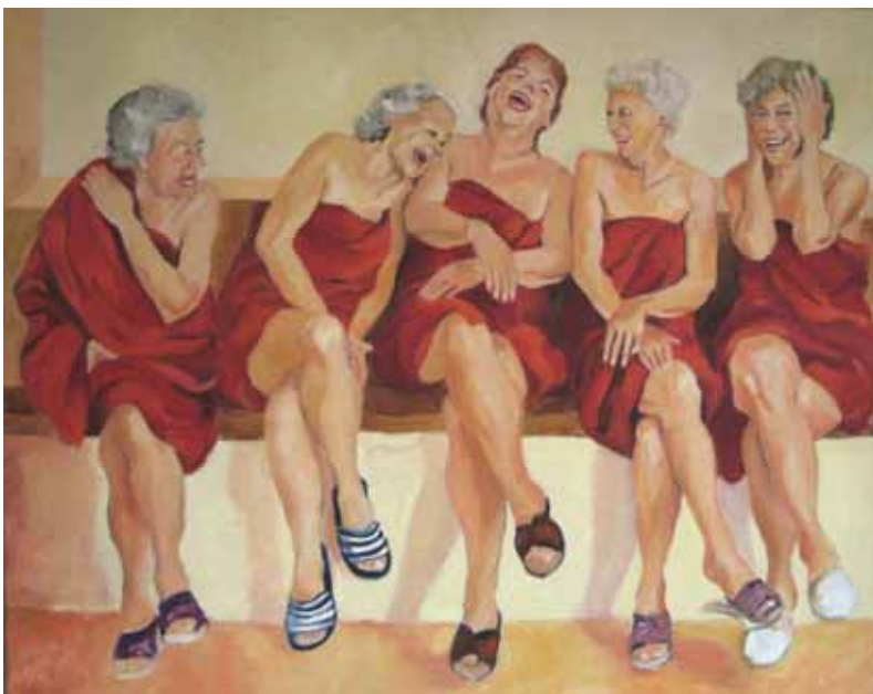
Bild links: „Lebenslust“, Ölgemälde von Ilona Nolte, Foto: Elisabeth Becker-Christ

Schmid, Wilhelm: Frauen sind (Lebens)Künstler, in: Psychologie heute 2008, Heft 4, S. 46-51.