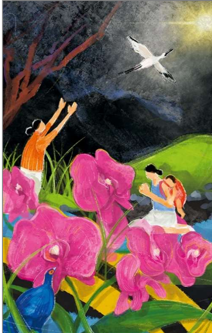
Titelbild zum Weltgebetstag 2023, Hui-Wen Hsiao © World Day of Prayer International Committee