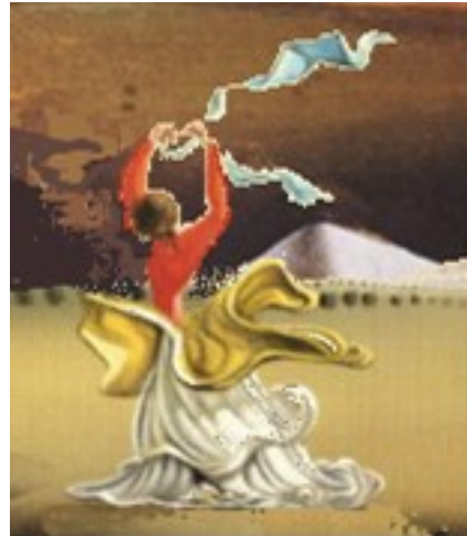
Ausschnitt spanische Tänzerin Salvadore Dali

Nach dem Abendessen und einer kleinen Abendrunde gibt es für die noch Fitten das Angebot, einen Film anzuschauen oder Sie tun, wozu Sie gerade Lust haben.