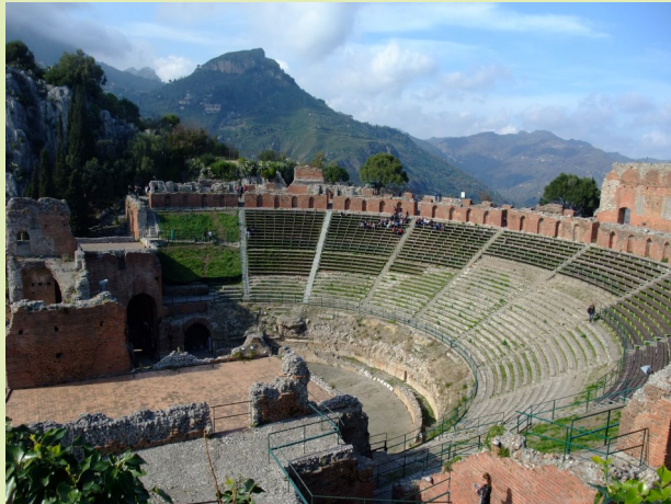
Antiker Tempel in Taomina