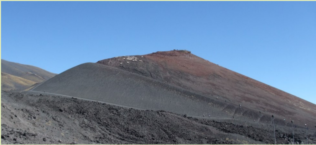
Vulkan Ätna, Silvestri-Krater 1900m

Auffahrt zu den Silvestri-Kratern auf 1900 m Höhe. Fakultativ: Je nach Wetterbedingung und Vulkantätigkeit Seilbahnauffahrt und weiter mit Spezialfahrzeugen in Begleitung eines Bergführers zu den südöstlichen Kratern auf 2900 m Höhe. Am Nachmittag geführter Rundgang durch Taormina .