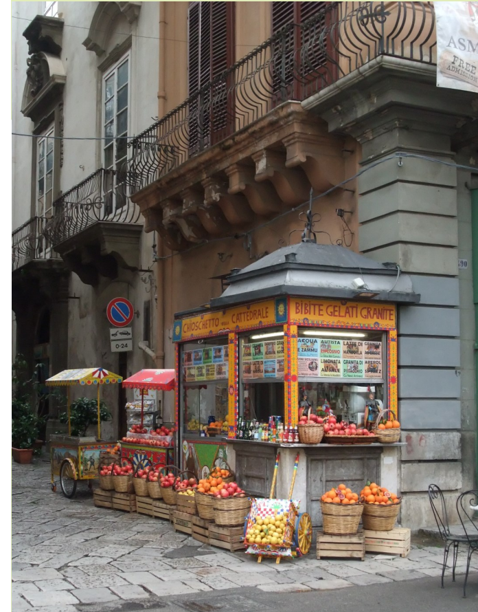
Am Domplatz in Palermo, Sizilien

Antike Kulturen, brodelnde Vulkane und Initiativen gegen die Mafia